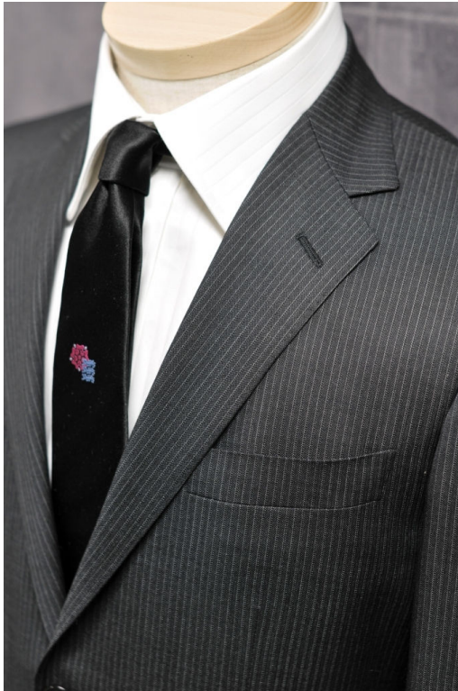
右写真:タイの柄アップ ⇒