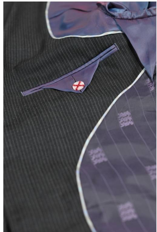
ジャケット内仕様 (パイピングはチームカラーのサックスブルー)