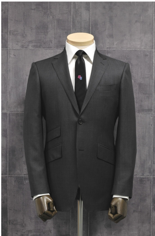
オフィシャルスーツ