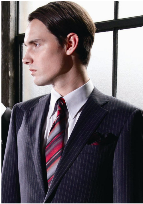
スタジオ・バイ・ダーバン「ジーキュー」 ニュージーランド・メリノウール使用 2011 年秋冬ス ーツ